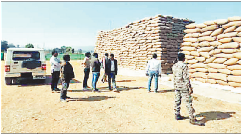
जांच करते अधिकारी