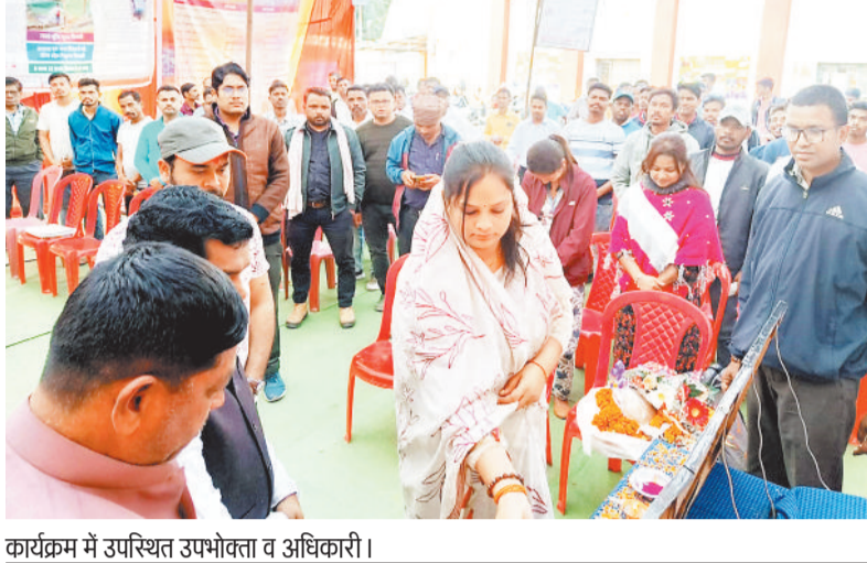
कार्यक्रम में उपस्थित उपभोक्ता व अधिकारी।

छग राज्य गठन के 25 वर्ष पूर्ण होने पर विद्युत वितरण केन्द्र के कनिष्ठ अभियंता केन्द्र ग्रामीण बैकूटपुर कार्यालय परिसर में 2 फरवरी को रजत जयंती समारोह का आयोजन किया गया। कार्यक्रम का उद्देश्य राज्य के विकास में विद्युत वितरण व्यवस्था की भूमिका को रेखांकित एवं उपभोक्ताओं के योगदान को सम्मानित करना रहा। कार्यक्रम के दौरान बीपीएल, घरेलू, गैर घरेलू, कृषि पंप कनेक्शन धारी उपभोक्ताओं तथा प्रधानमंत्री सूर्यघर मुक्त बिजली योजना के तहत सोलर कनेक्शन लेने वाले उपभोक्ताओं को प्रशस्ति पत्र प्रदान कर सम्मानित किया गया। रजत जयंती आयोजन के माध्यम से विद्युत सेवाओं के विस्तार और उपभोक्ताओं के योगदान को सराहना गया।